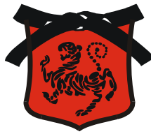
Foto und Film / Recht am Bild: Während der Veranstaltung werden Foto- und Videoaufnahmen gemacht, auf denen die Teilnehmer (TN) abgebildet sein können. Wir beabsichtigen diese Bilder und Videos zu Werbezwecken auf die Homepage der teilnehmenden Vereine sowie des Karatelandesverbandes zu stellen. Mit der Anmeldung erteilt jeder TN die Einwilligung zur Verwendung der Fotos für den vorbeschriebenen Zweck. Die Einwilligung für Einzelabbildungen ist jederzeit widerruflich. Der Widerruf ist dem Veranstalter schriftlich mitzuteilen.